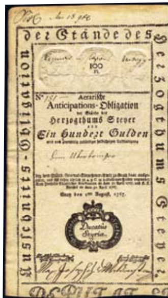
Štýrská erární anticipační obligace 100 Gulden, 1.8.1767, PR W 19