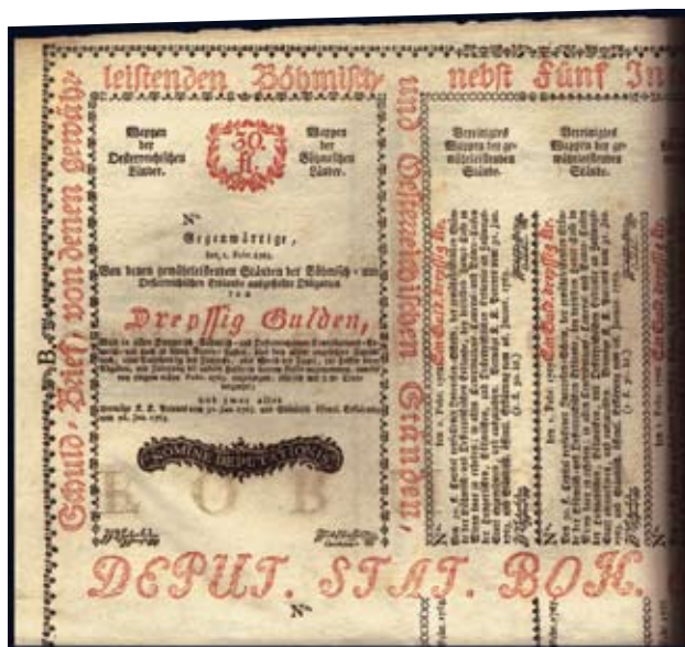
Vzor obligace stavů českých a rakouských dědičných zemí včetně kuponů 30 Gulden, 1.2.1763, PR W 7, S -

Výdělek tesaře byl asi 6 a 1/2 zlatého měsíčně * Ministr státní sekretář Bluemegen měl roční příjem 12 000 zlatých, kancléř Kounic 8 800 zlatých. * Výživa vězně v brněnské pevnosti Špilberk stála 4 krejcarů denně. * Pěšák v rakouské armádě měl žold 3 zlaté měsíčně (z toho polovinu ve stravě), polní maršál 1 500 zlatých měsíčně. * Osminka vína stála od 5 a 1/2 do 8 a 1/2 krejcarů.